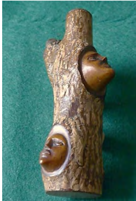
Afb. 1. Houten pijp van kurkiep met gezichten. (Coll. Piet Smiesing)