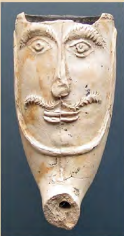
Gezichtspijp, maar waar vandaan? Zie blz. 81