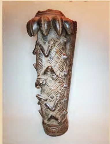
Een reparatie van een Bamiléké pijp, zie blz. 96