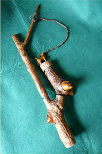
Pijpen met gezichten vervaardigd uit takken, zie blz. 91